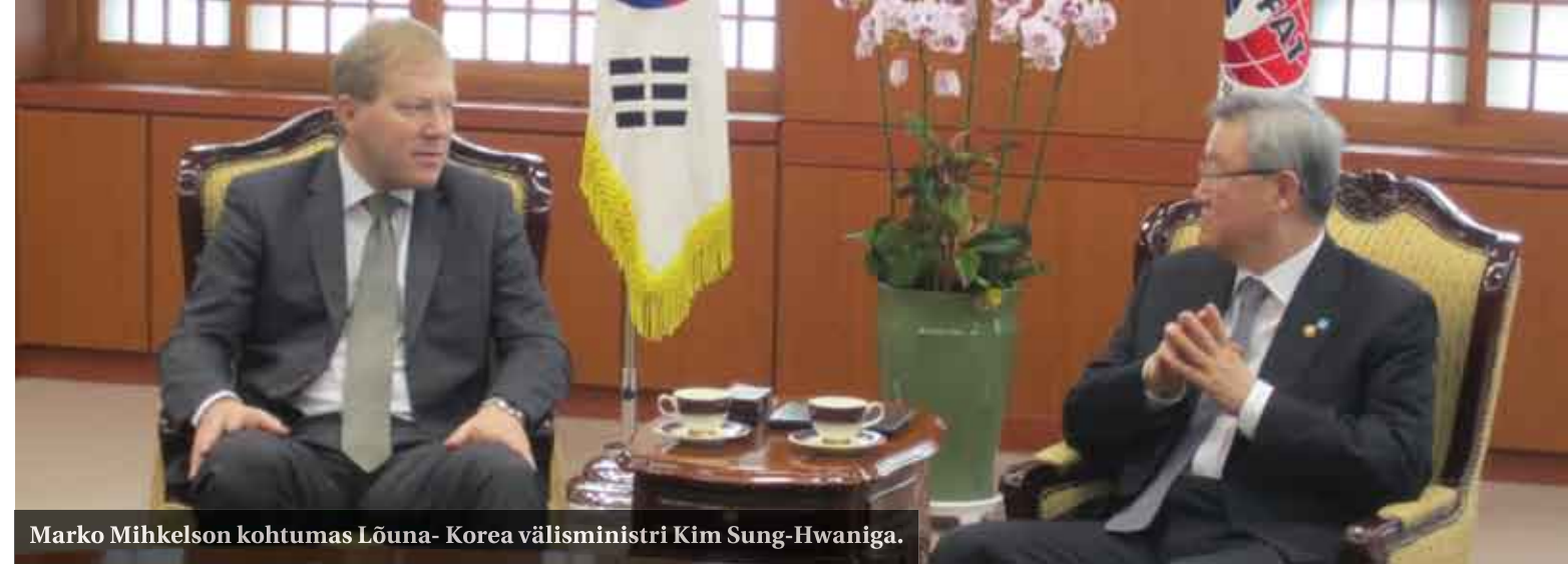
Marko Mihkelson kohtumas Lõuna- Korea välisministri Kim Sung-Hwaniga.

Konservatiivne eelarvepoliitika on meile siiani edu toonud ja oleks vale seda suunda mitte jätkata. 2012. aasta riigieelarve on vastutustundlik ja koostatud eelkõige tulevikku vaatavalt.