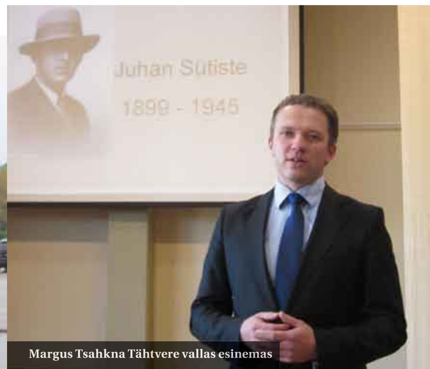
Margus Tsahkna Tähtvere vallas esinemas