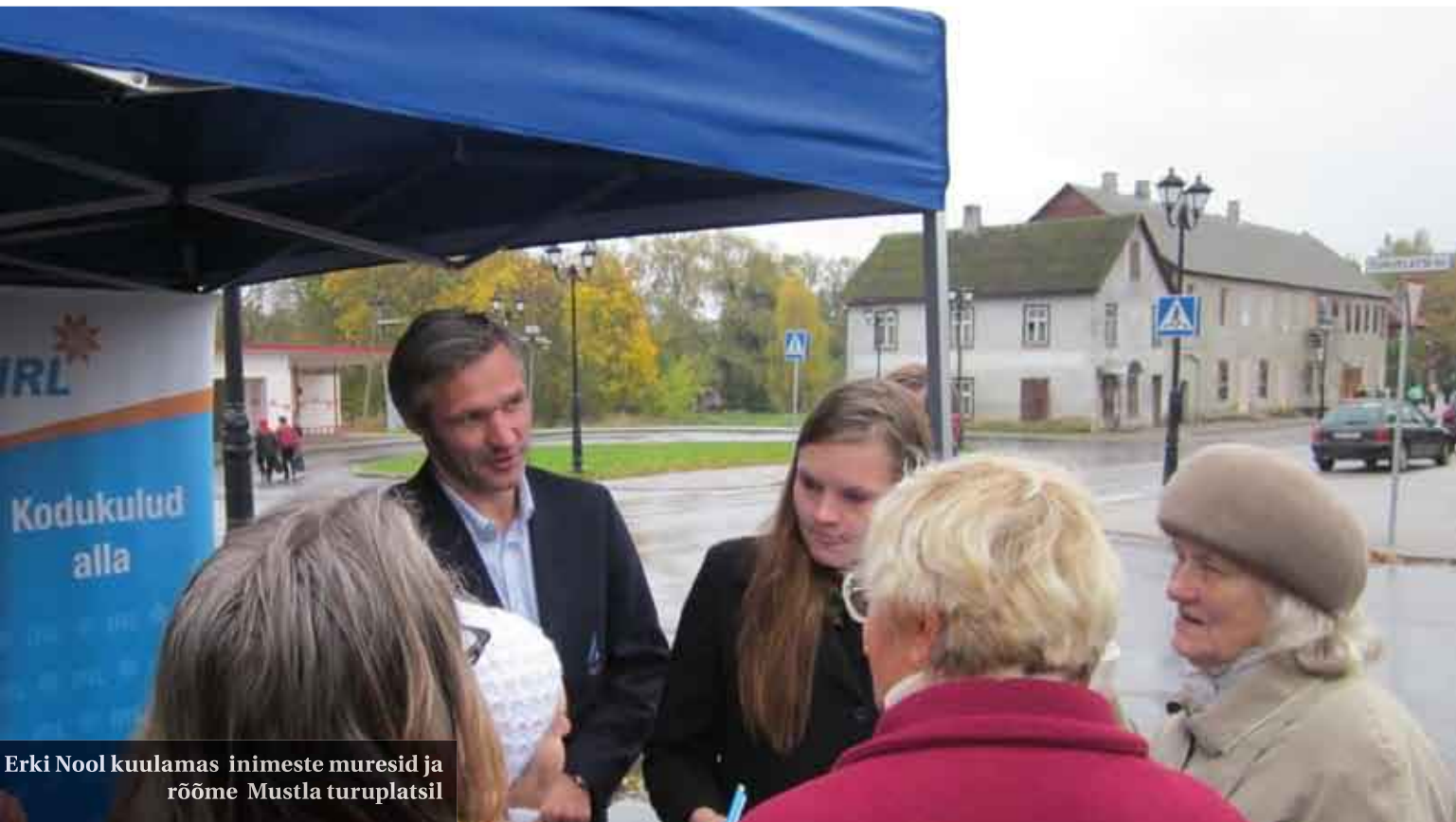
Erki Nool kuulamas inimeste muresid ja rõõme Mustla turuplatsil