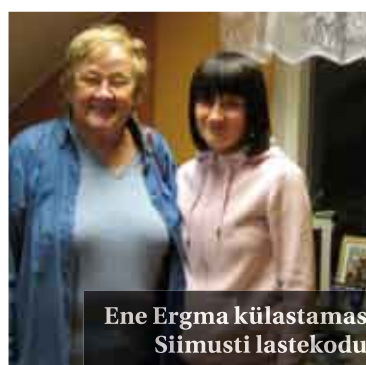
Ene Ergma külastamas Siimusti lastekodu