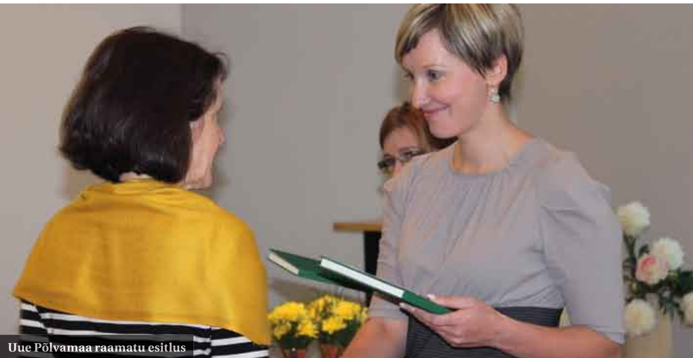
Uue Põlvamaa raamatu esitlus

M illine on olnud Teie elukäik enne maavanemaks saamist?