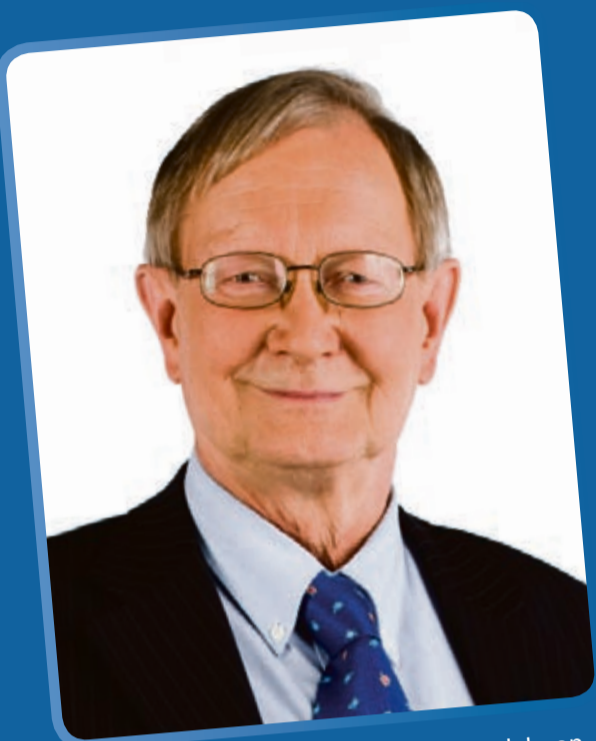
Tunne Kelam. Tegevusvaldkondadeks on niihästi ELi välis- ja julgeolekupoliitika kui ka regionaalse arengu küsimused. Kuulun ka EP ja Vene Riigiduuma koostöökomisjoni.