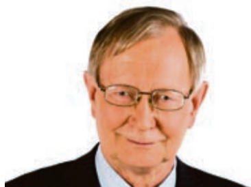
Tunne Kelam IRLi saadik Euroopa Parlamendis

Hea lugeja! Eesti kodaniku jaoks on 7. juuni valimised Euroopa Parlamenti kõikidest üldvalimistest kõige vastutusrikkamad. Miks?