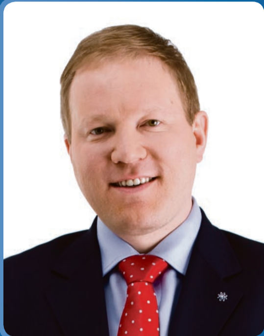
Marko Mihkelson. Usun, et oma pikaajalise välispoliitilise kogemusega suudan pakkuda ideid ja lahendusi erinevatele küsimustele, mis on korruga nii Eesti kui laiemalt Euroopa Liidu huvides.