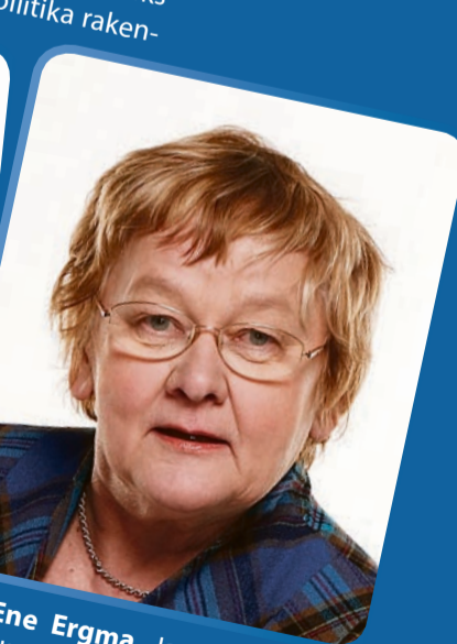
Ene Ergma. Isamaa ja Res Publica Liidul on Eesti huvide eest seismiseks vajalik tahe ja välispoliitiline kompetents. Soovin toetada Eestit ja oma erakonda.