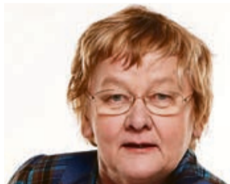
Ene Ergma Riigikogu esimees, IRLi kandidaat Euroopa Parlamenti

Euroopa Parlamendi valimiseni on jäänud vähem kui kuu. Sel korral toimuvad valimised Kesk- ja Reformierakonna ponnistuse viljana suletud nimekirjade alusel.